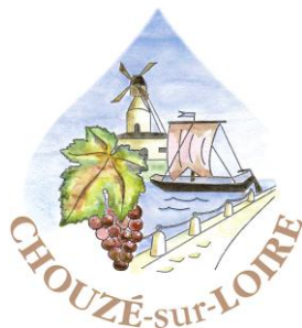
TABLEAU RECAPITULATIF DES INDEMNITES DE FONCTIONS DES ELUS A COMPTER DU 01 AVRIL 2026 Annexe à la délibération du 2 mars 2026.

(Article 92 DE LA LOI 2019-1461 du 27 décembre 2019 - article L 2123-23 et L2123-24 du CGCT)