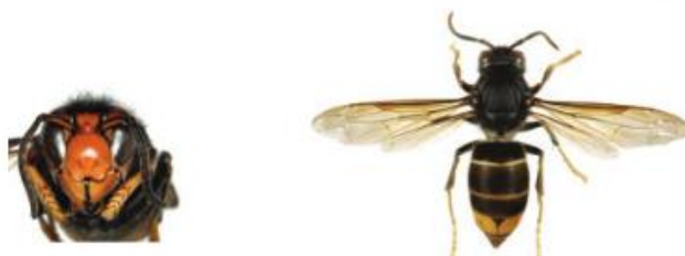
Frelon asiatique à pattes jaunes, Vespa velutina

Le frelon est reconnaissable car il est majoritairement noir, avec une large bande orange sur l'abdomen et un liseré jaune sur le premier segment. Sa tête vue de face est orange, et les pattes sont jaunes aux extrémités. Il mesure entre 17 et 32mm.